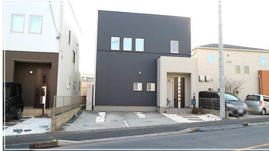
上柴西小学校・上柴中学校区域