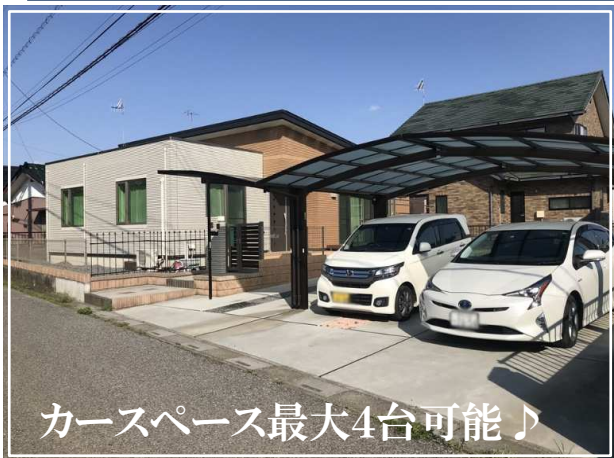
カースペース最大4台可能♪